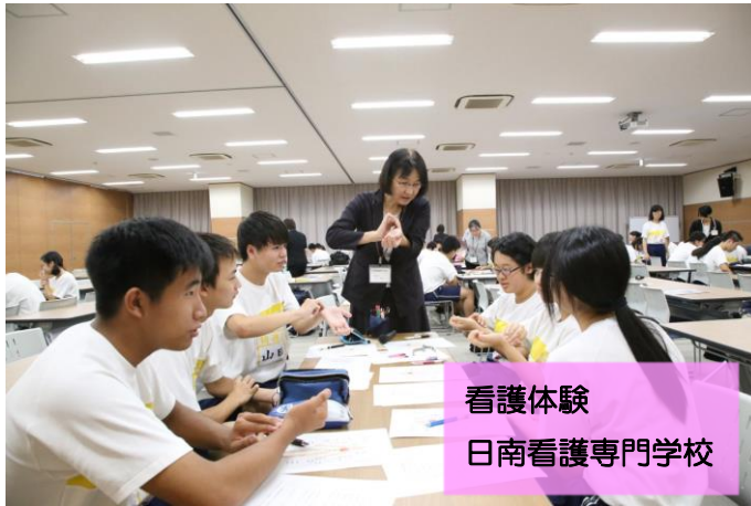
看護体験 日南看護専門学校